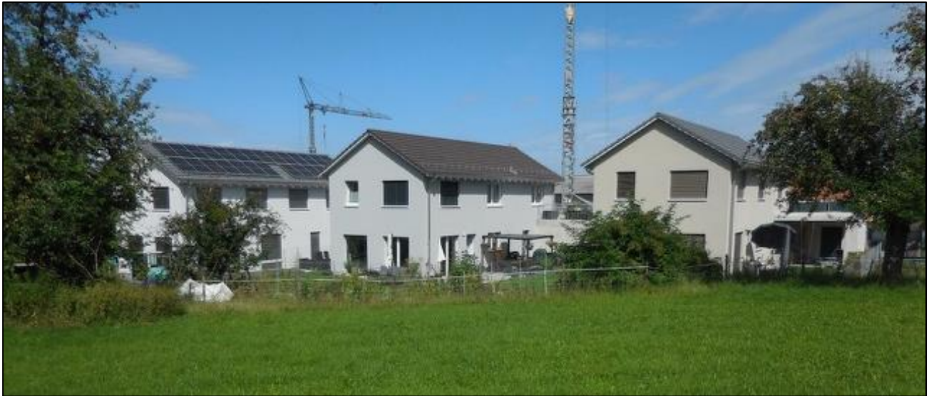
Überbauung «Im Brühl», Parzellen Nrn. 1540 – 1542 (Blickrichtung Ost).